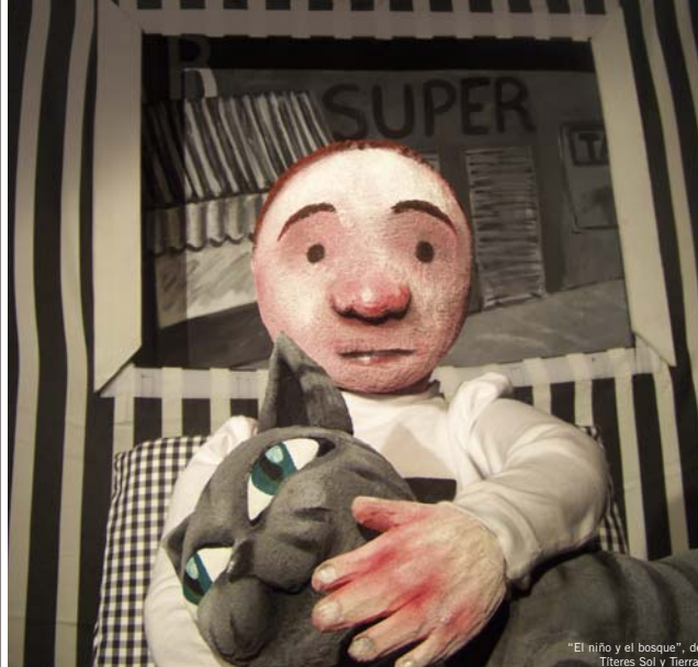
"El niño y el bosque", de Titeres Sol y Tierra.

Entre los días 5 y 8 de noviembre se celebró la IV edición del Encuentro de Teatro Sierra Norte, que cada año acogen varias localidades madrileñas. Este evento está organizado por el colectivo Sierra Teatra, la Mancomunidad de Servicios Culturales Sierra Norte y el Centro Comarcal de Humanidades Sierra Norte, y entre sus objetivos se encuentran la incentivación de la creación y la profesionalización de las creaciones escénicas que se realizan en esta zona, y la fidelización del público, que año a año está convirtiendo esta cita en un importante y esperado acontecimiento teatral. A lo largo de sus días de desarrollo fueron representados doce espectáculos de géneros tan variados como el teatro de texto, el mimo-