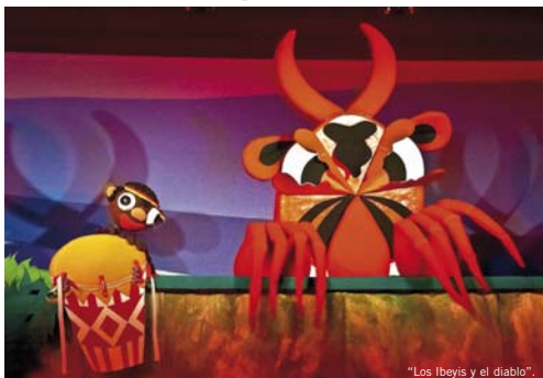
"Los Ibeys y el diablo".

La compañía de teatro zaragozana Teatro Arbolé recogió el pasado 6 de octubre el premio Galicreques, que se concedió por primera vez en el marco de la XIV edición de este Festival Internacional de Títeres de Santiago de Compostela. Arbolé recibió este galardón en reconocimiento a su trayectoria profesional y a su actividad a nivel nacional e internacional a favor del títere. El Festival Internacional de Títeres de Santiago de Compostela, que se celebró del 2 al 11 de octubre y que concederá estos premios a partir de ahora de manera anual, acogió además las representaciones de las obras "Los tres cerditos" y "Los Ibeys y el diablo", ambas de la compañía aragonesa galardonada. Teatro Arbolé nació en Zaragoza en 1979 como una pequeña compañía de títeres. Hoy, tres décadas después, ha afianzado un proyecto empresarial que no sólo genera cultura e ilusión, sino también puestos de trabajo, y que ha trascendido el mundo del títere para consolidarse como empresa productora, programadora, exhibidora, formadora y editora.