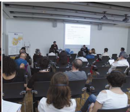
Muchos fueron los profesionales que no quisieron perderse la nueva edición de los Encuentros COFAE con Ferias y Festivales Europeos, que en esta ocasión estuvo protagonizada por el evento anfitrión y el festival Mimos de Perigueux (Francia).