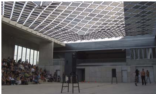
Un instante de la representación de "¿Por qué será?", de Ana Continente Danza, en un espacio exterior cubierto del Palacio de Congresos de Huesca.

Sin embargo, no todos los índices han sido positivos: "El número de stands es la única variable que ha bajado –aclara el propio Argüés–. Ha habido 34 stands frente a los 42 que hubo el año pasado. No creo que este hecho responda a la crisis, ya que este año han acudido 40 profesionales más que en 2008. Pienso que ha sido algo puntual, porque el año pasado acabábamos de estrenar el Palacio de Congresos y no pudimos ofrecer un diseño que fuera interesante para los expositores como ha