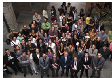
Representantes de las entidades promotoras del Plan Integral de Danza de Cataluña, y media centena de profesionales del sector, se concentraron el pasado 8 de octubre para dar a conocer el documento.