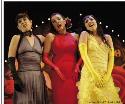
"Cabaret Ilíquido", Lavi e Bel.

Juan Mayorga es el autor al que este año homenajeará, en su acto de apertura, la Muestra de Teatro Español de Autores Contemporáneos, que celebrará su XVII edición en Alicante entre los días 6 y 15 de noviembre. El dramaturgo madrileño se une así a otros importantes dramaturgos que recibieron este reconocimiento en años anteriores, como Antonio Buero Vallejo, Fernando Arrabal, Fernando Fernán Gómez o Alfonso Sastre, por mencionar solo algunos.