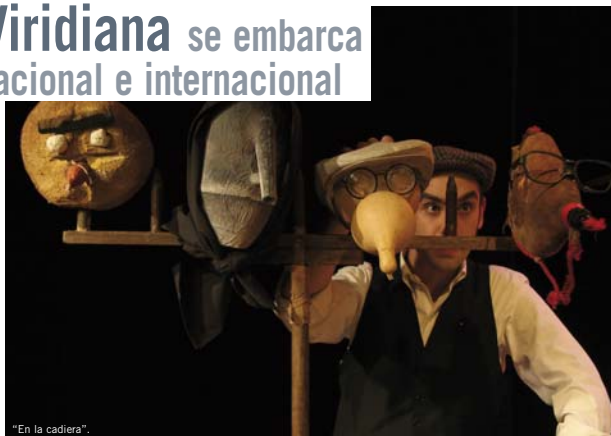
"En la cadiera".

La gira dio comienzo con "Gaviotas subterráneas", un texto de Alfonso Vallejo que participó los días 29 y 30 de octubre en el teatro del Raval en la XIV Mostra de Teatre de Barcelona, certamen en el que la obra "Un día, una hora" –También de Producciones Viridiana– ganó el Premio al Mejor Espectáculo en la edición del año pasado. Precisamente este último montaje, creado a partir de textos escritos por niños, se presentó en la VIII Fira Infantil i Juvenil de les Illes Balears Mallorca en el mes de octubre, y llegó a Laguna de Duero (Valladolid) el 7 de noviembre para participar en la ceremonia de entrega de los XXXVIII Premios de las Justas Poéticas y Cuento Corto. "Un día, una hora" cerrará su serie de funciones el día 3 de diciembre en Olot (Gerona).