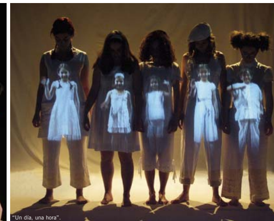
"Un día, una hora".

Por su parte la Red de Teatros de Castilla y León ha incluido el montaje "En la cadiera" en un recorrido por nueve de sus teatros. La gira comenzó el 23 de octubre en Aranda de Duero (Burgos), y pasará por el teatro Principal de Palencia el 25 de noviembre, la Casa de las Artes de Laguna de Duero el día 27, la Casa de Cultura de Miranda de Ebro (Burgos) el día 29, el teatro Cervantes de Valladolid el 22 de diciembre, el teatro Principal de Burgos al día siguiente, el teatro Liceo de Salamanca el día 29 y el teatro Palacio de la Audiencia de Soria el día 30 de diciembre. "La cadiera" participará también dentro de la Red de Espacios Escénicos de Aragón el 5 de diciembre en La Almunia de Doña Godina y el día 15 del mismo mes en Tauste, ambas localidades zaragozanas.