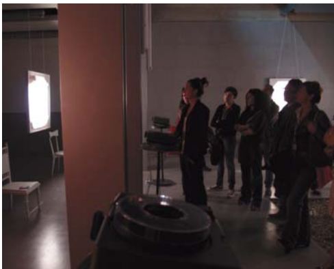
El espectáculo multidisciplinar "El lugar equivocado", de Dimitri Ialta, ofreció varias funciones a lo largo de la feria.