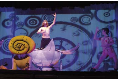
Una imagen de "Momo", de la compañía Titirimundi, musical con el que se abrió la programación de la sala Fli.