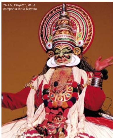
"K.I.S. Project", de la compañía India Nirvana.

La migración es una realidad cada vez más evidente en la sociedad española. Nuevos pueblos vienen a desarrollar nuestra economía, pero también a enriquecer nuestra cultura en todas sus vertientes. Cada vez surgen más propuestas basadas en la mezcla cultural, y para darles salida se crean proyectos como el Festival Internacional de las Artes Escénicas de la Región de Murcia, Otro, que ante el gran éxito de su primera edición, celebrada el año pasado, llevará a cabo la segunda entre los próximos días 10 y 15 de noviembre en el Centro Párraga de la capital murciana.