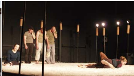
La compañía danesa Granjøj Dans representó en Huesca varias de las piezas que componen su repertorio, entre ellas "Obstrucsong".

opiniones muy acentuada. Ha sido una edición de la feria en la que las opiniones estaban muy divididas, desde el jurado de los premios, que tuvo unos problemas tremendos para establecer unos criterios, hasta los programadores. Ha habido una diversificación muy grande que no responde a la heterogeneidad de los espectáculos exhibidos, sino a la heterogeneidad de los programadores asistentes. Los espectáculos eran para todos los mismos, y sin embargo había gente que alababa un montaje y otros lo denostaban terriblemente. Ha sido una feria muy dialogada en ese sentido, en la que se ha producido mucha disparidad de criterios".