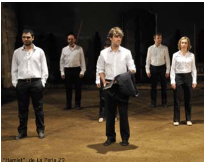
“Hamlet”, de La Perla 29.

Casi diez mil personas, en concreto 9.700, acudieron al reclamo de la XIV edición de la Fira de Teatre de Manacor, que tuvo lugar en la ciudad mallorquina entre los días 18 y 27 de septiembre. De entre todos los asistentes, más de 80 se acreditaron como profesionales del sector, de los cuales aproximadamente 60 eran programadores, procedentes en su mayoría de Cataluña, Comunidad Valenciana y las Islas Baleares, pero entre los que también los había de otros lugares de nuestro país e incluso de Andorra. Esta edición albergó 30 espectáculos y 40 representaciones, que en más de un 50% fueron puestas en escena en catalán. Muchas de las obras exhibidas constituían estrenos en las Islas Baleares. Las actividades paralelas que acogió la Fira de Teatre de Manacor estaban divididas en dos grupos. Por un lado, se llevaron a cabo las reuniones de la Asociación de Teatros y Auditorios Públicos de las Islas Baleares –que el día 23 entregó sus premios de artes escénicas–, y la de los programadores del Proyecto Alcover, dedicado al intercambio de espectáculos teatrales. Por otro lado, la Dirección General de Cultura del Gobierno de las Islas Baleares organizó dos mesas redondas que llevaron los títulos de “La movilidad de las artes escénicas” y “Dos años después del PESAEM”, en las que participaron destacados profesionales del sector.